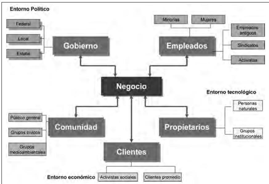
Gráfico 4. La propuesta de Freeman