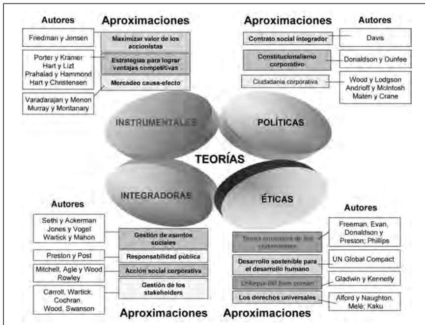
Gráfico 1. Enfoques teóricos sobre responsabilidad social corporativa