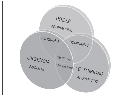
Gráfico 6. Tipología de Mitchell

dores o la alta dirección de las firmas, que perciben e interpretan el entorno de la organización. Los actores que no presentan al menos uno de estos atributos (no afectan los resultados y/o no son afectados por ellos) no son stakeholders . Esta propuesta proporciona una equiparación de las perspectivas prescriptiva y descriptiva, en la medida en que sugiere que la finalidad (real e ideal) de las organizaciones es satisfacer las expectativas de los stakeholders . La cuestión es saber qué expectativas prevalecen sobre otras y qué implica ello. Al poner a interactuar los tres elementos pueden identificarse tres grandes grupos de stakeholders : latentes, vigilantes y definitivos. La tipología propuesta por los autores en mención se ilustra en el gráfico 6.